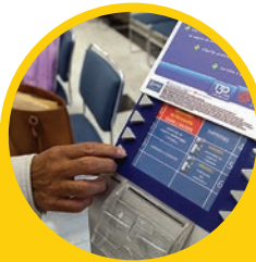
MOSTRADOR DE TURNOS