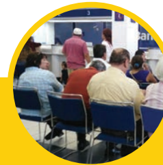
SILLAS Y MESAS