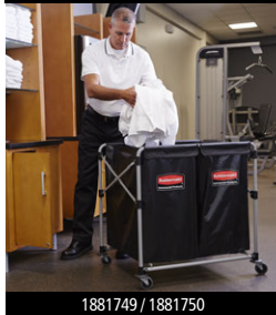
1881749 / 1881750

Utilice los diferentes contenedores con tapa para mantener los suministros protegidos 1 .