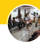
SILLAS Y MESAS EN SALAS DE ESPERA