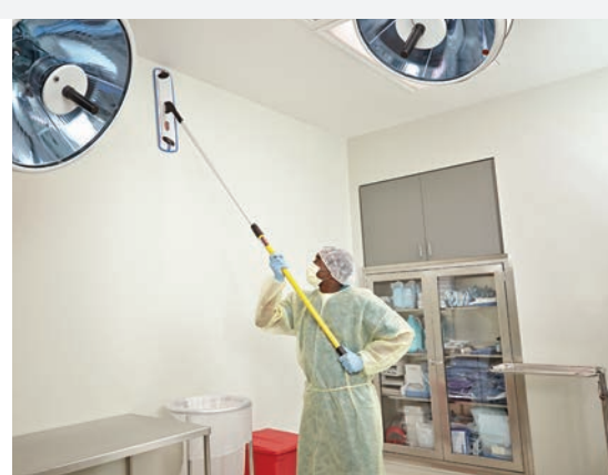
MOPAS DE MICROFIBRA PLANAS