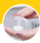
DISPENSADOR DE GEL

La mayoría de las instalaciones de salud limpian con productos desechables que no remueven los microbios de las superficies. Estos microorganismos muertos actúan como fuente de alimento para patógenos vivos y pueden incrementar el riesgo de infección.