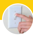
INTERRUPTORES DE LUZ